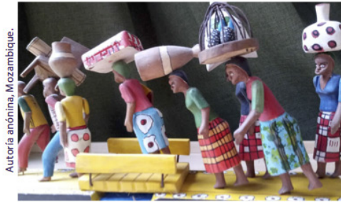
Autoría anónima. Mozambique.